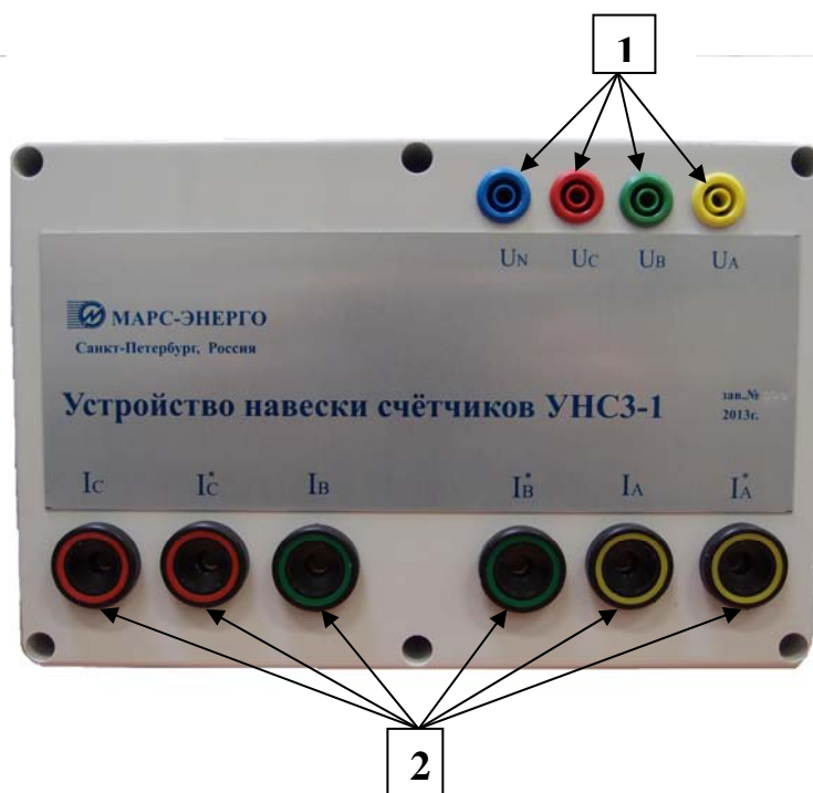
Ри. 3. Блок подключения к установке. 1 – разъемы по напряжению, 2 – разъемы по току