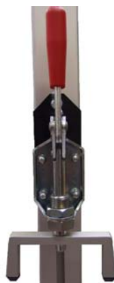
Рис. 4. Устройство для вертикальной фиксации